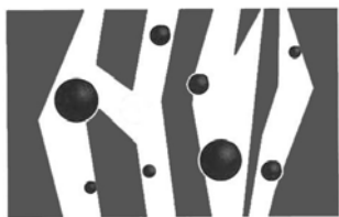
ADSORBIMENTO Absorptive Retention Figura 1

Agent for South Italy: Sire srl - Via Sannio, 9 80146 Napoli Tel. 0817349254-0817349310 Fax 0817349317