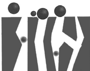
SBARRAMENTO MECCANICO Mechanical Retention Figura 2